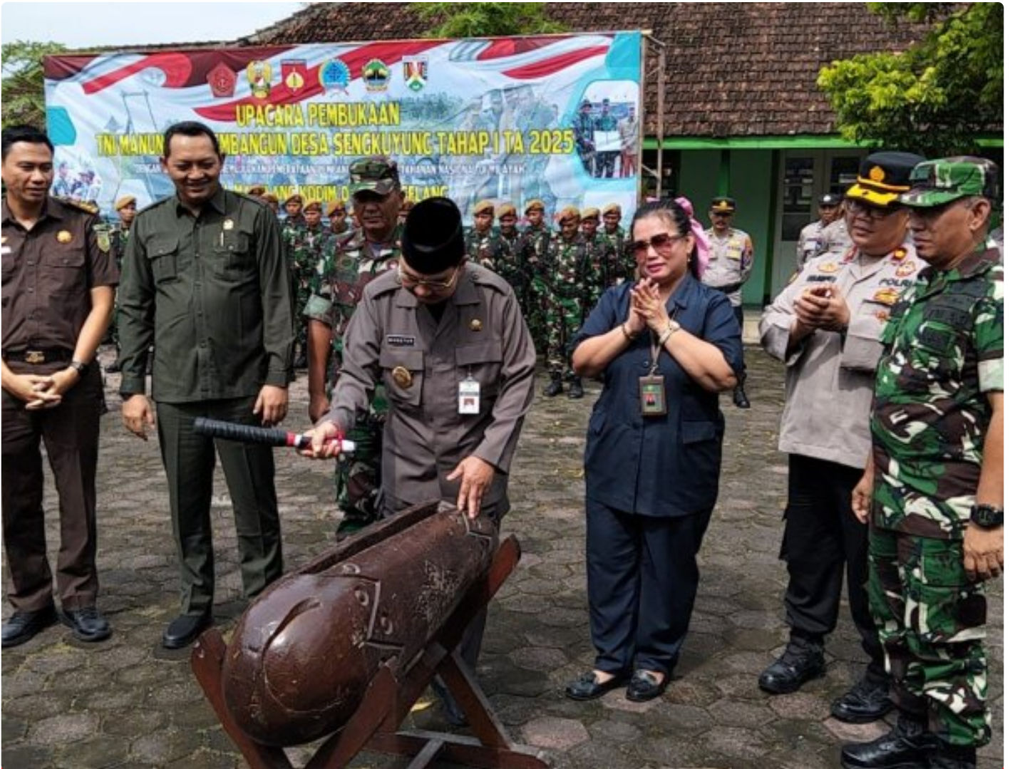
(Foto Dokumen) : Wakil Walikota Magelang didampingi Forkopimda memukul kentongan saat Upacara Pembukaan TMMD

MAGELANG - TMMD Sengkuyung Tahap I Kota Magelang secara resmi telah dibuka. Hal ini ditandai dengan digelarnya Upacara Pembukaan TMMD Sengkuyung Tahap I Tahun 2025 di Halaman SD Kartika III-3, Jl. Kapten Suparman, Kelurahan Potrobangsari, Kecamatan Magelang Utara, Kota